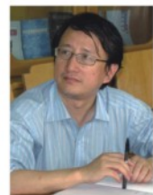
吴朝晖 84级混合班 浙江大学校长 973计划项目首席 国家杰出青年基金获得者